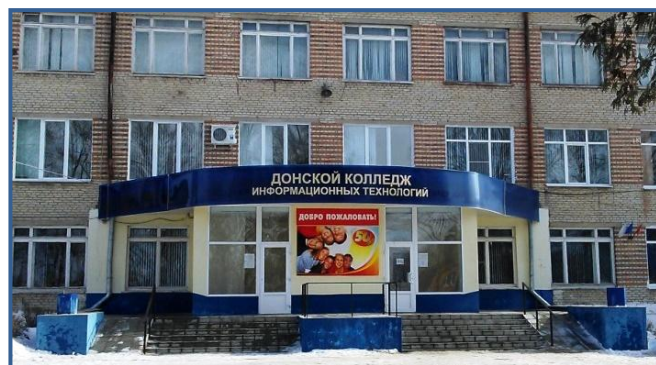
ДКИТ, 2016 г.